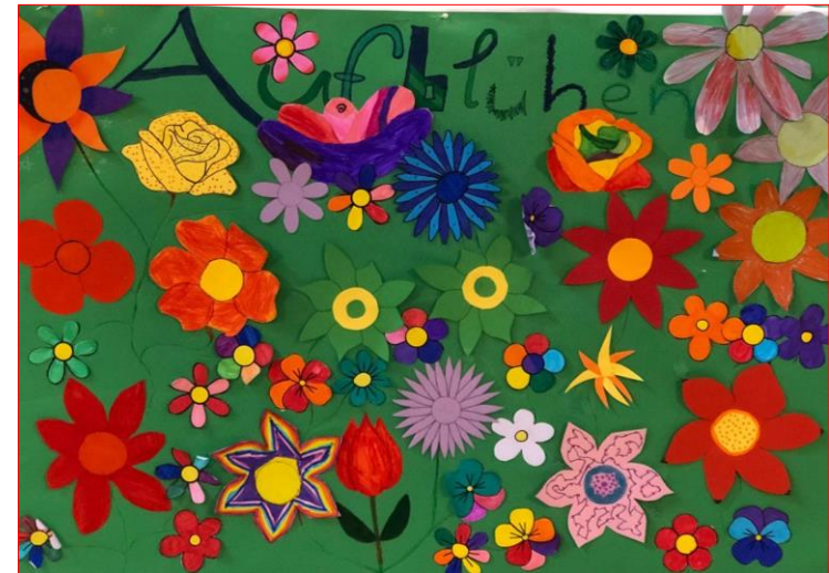
„Aufblühen“ – das Bild wurde von den Grundschulern Riffian gestaltet