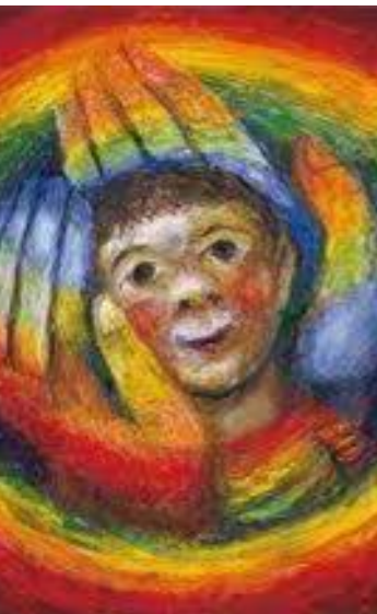
Sieger Köder: in Gottes Händen

So steht am Anfang dieser Karwoche, an die Erinnerung des Leidensweges Jesu nicht nur der Vorsatz der Hohepriester oder der Verrat des Jüngers. Nein da steht ein Zeichen großer Liebe. Die Liebe Jesu ist alle Zeit wert, die wir investieren in andere. Seine Passion, sein Weg zum Kreuz, sein Leben für uns gegeben ist mehr als alles andere. Amen